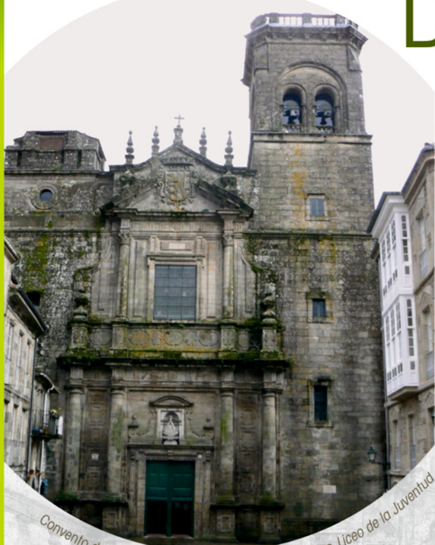
Convento de Santo Agostiño, no que se emprazaba o Liceo de la Juventud

A mediados do século XIX, nun momento determinante para a súa formación, Rosalía trasládase a Santiago de Compostela. Na Sociedad Económica de Amigos del País estuda música e debuxo; participa nas actividades que organiza o Liceo de la Juventud e relaciónase coa intelectualidade comprometida co futuro da nación.